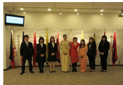
講演者 & 司会・受付・撮影者